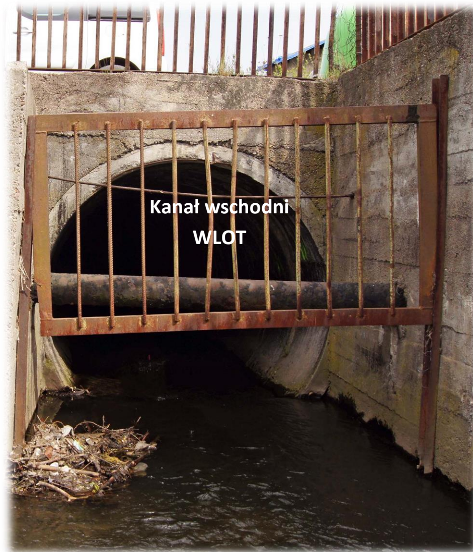
POTOK SZCZAWNIK – dokumentacja fotograficzna zakrytej części potoku – KANAŁ WSCHODNI