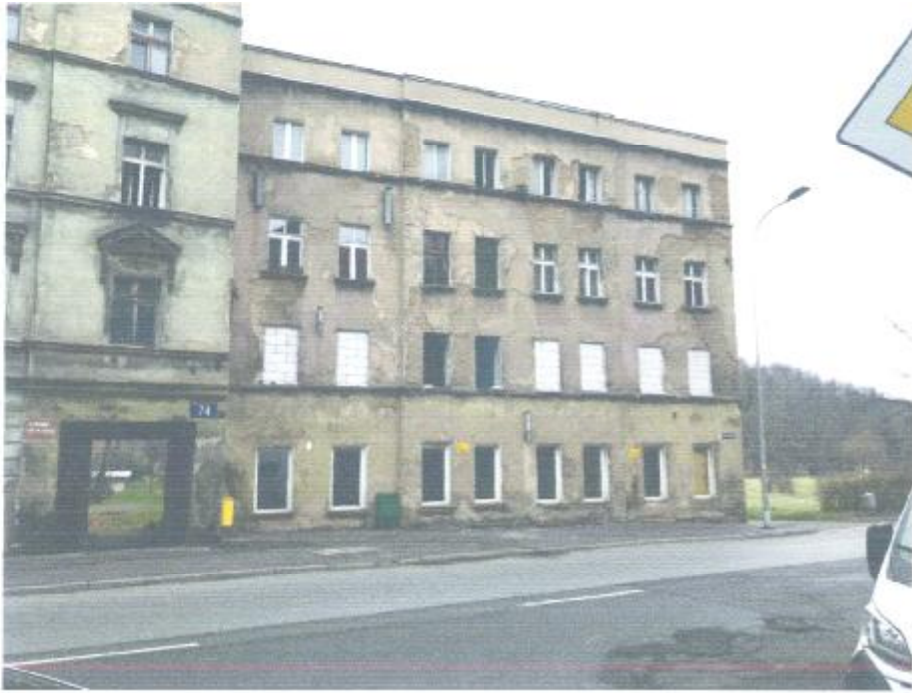
Widok od strony południowej