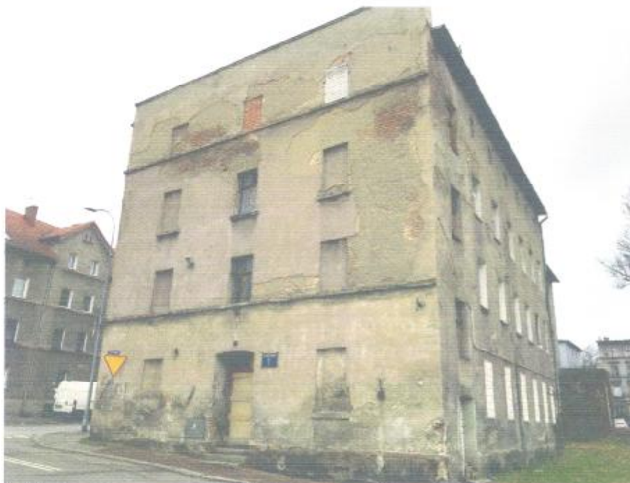
Widok od strony wschodniej

Zewnętrzne ściany wykonane są z cegły pełnej na zaprawie cementowo-wapiennej. Warstwę licową ścian zewnętrznych stanowią tynki cementowo-wapienne. Ściany wewnętrzne wykonane są z cegły pełnej na zaprawie cementowo-wapiennej. Strop nad piwnicą i klatką schodową wykonany jako ceramiczny na belkach. Stropy między piętrowe wykonane jako stropy drewniane belkowe ze ślepym pułapem i podsufitką. Podłogi z desek. Biegi klatki schodowej betonowe, metalowe balustrady. Budynek posiada płaski jednospadowy dach kryty papą. Więźba dachowa drewniana. Nadproża okienne i nad wejściami wykonane są jako płaskie. Kominy murowane z cegły klinkierowej. Obróbki blacharskie rynny i rury spustowe wykonane są z blachy ocynkowanej. Budynek posiada dwa wejścia – jedno od strony wschodniej (wejście od ulicy) drugie od północy. Budynek jest mocno wyeksploatowany. Na podstawie zrealizowanego przeglądu pięcioletniego zużycie budynku określono na poziomie 51,93%