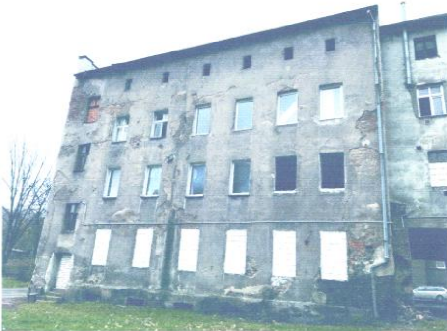
Widok od strony północnej.